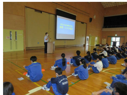
【相馬署員の方による講話】