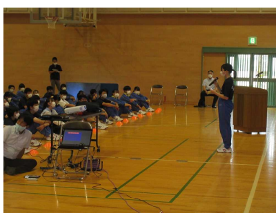
【ケータイ・スマホ使い方宣言】