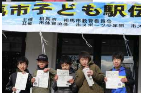
表彰後の6年生チーム

11月25日に開催された「相馬市子ども駅伝競走大会」に本校から6年生男女2チームが参加しました。各チーム5名で襷（たすき）をつなぎ、見事にゴールしました。結果は5・6年生の部で男女ともに優勝しました。おめでとうございます。大変よく頑張りました。