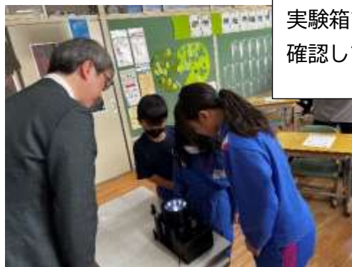
実験箱で放射線の動きを確認しているところ