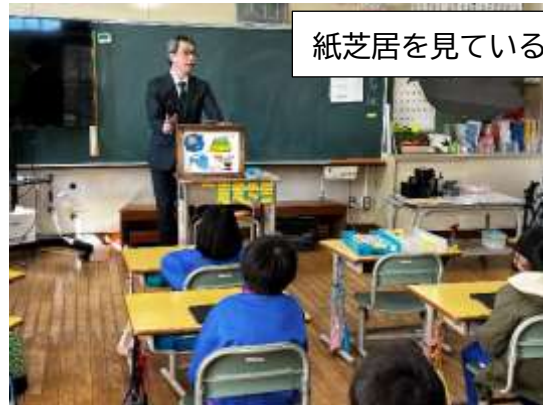
紙芝居を見ているところ

出前授業を通して、子どもたちは、放射線は怖いものではなく、レントゲン検査に放射線が使われるなど、自分たちの身の回りにあるものという理解ができました。