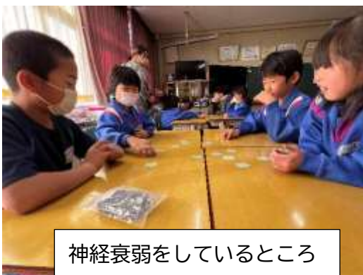
神経衰弱をしているところ