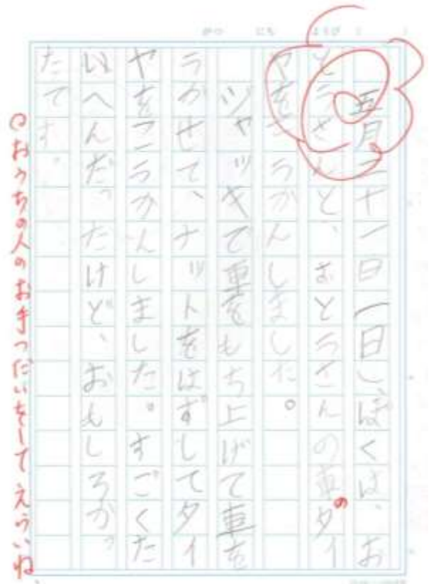
(きょうのちぶんふくしゅう)

低学年でこういう取り組みをやっておくと、中学年、高学年になった時、充実した自主学習をすることができるようになるでしょう。