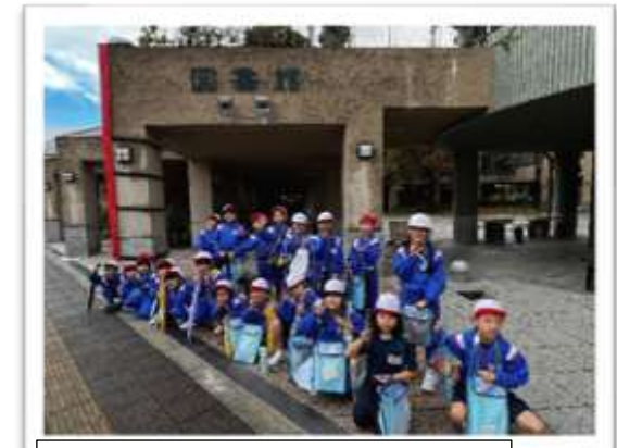
11月南相馬市中央図書館見学