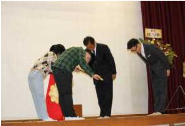
創立150周年式典での「新校旗贈呈」

本年度、相馬市立大野小学校は創立150周年を迎えました。10月22日の創立記念日に、150周年記念式典とともに「大野祭」を開催しました。お陰様で本年度は、お客様の入場制限を行わず、通常開催することができました。児童たちも練習を重ね、150年の歴史を引き継ぎ、未来へ繋がる堂々とした発表をすることができました。お忙しい中、ご出席いただき、誠にありがとうございました。