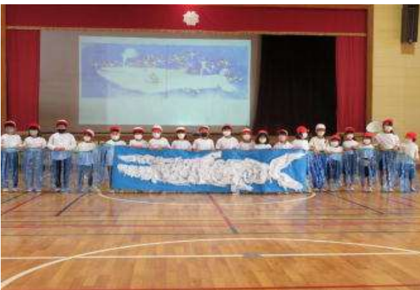
1年生の発表の様子

10月29日の「大野祭」は、昨年度に引き続き、お客様の人数制限や入れ替え制等のコロナ対策にご協力をいただきなが