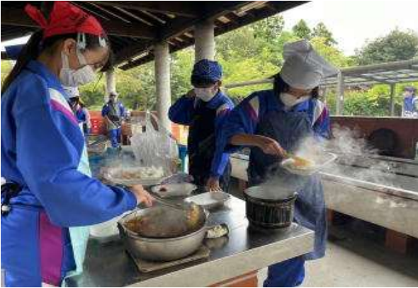
6年生の宿泊学習「野外炊飯」

10月12日は1～5年生の見学学習を、同じく12～13日は6年生の一泊二日による宿泊活動を実施しました。