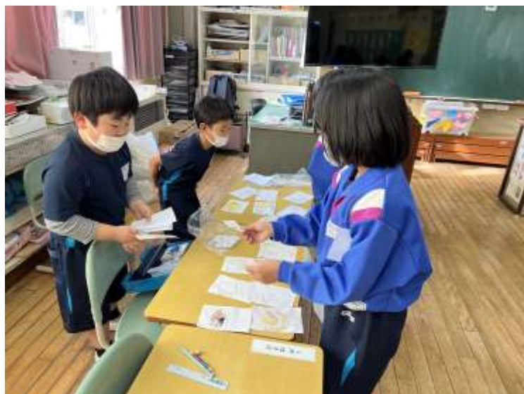
↑買い物している様子。