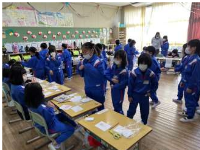
↑2年生が買い物に来てくれました。